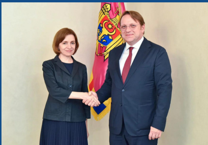
Европейский комиссар ОЛИВЕР ВАРХЕЛИЙ и президент Республики Молдова МАЙЯ САНДУ

населенным пунктам по всей стране с информационно-разъяснительной кампанией. Инициатива «Граждане за Европу» призывает к активному участию местных сообществ, гражданских организаций, ассоциаций, местных лидеров и волонтеров для обеспечения массового и осознанного участия в референдуме о вступлении Республики Молдова в Европейский Союз, чтобы голос каждого гражданина был услышан.