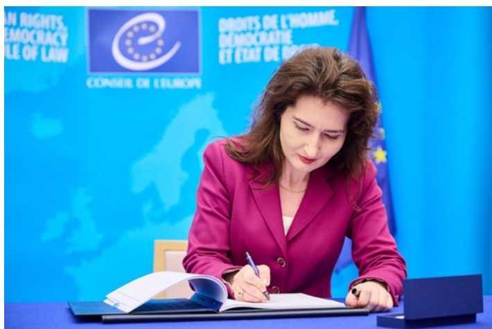
Постоянный представитель Республики Молдова при Совете Европы, посол Даниэла Кужбэ

Это председательство проходит в важный момент продвижения Молдовы по пути европейской интеграции.