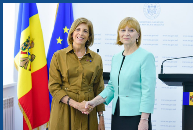
Европейский комиссар по здравоохранению и безопасности пищевых продуктов Стелла Кириакидес и министр здравоохранения Молдовы Алла Немеренко

Подписание Соглашения состоялось в Кишиневе, 9 июля во время официального визита европейского комиссара по здравоохранению и безопасности пищевых продуктов Стеллы Кириакидес.