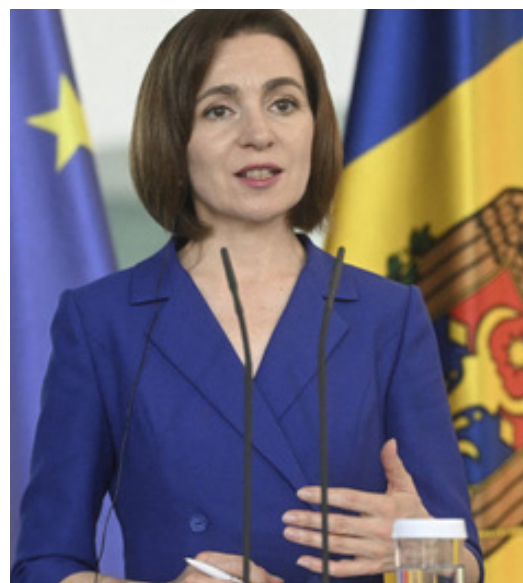
MAIA SANDU, Președintele Republicii Moldova

Cu toate acestea, dacă referendumul va avea un rezultat pozitiv, iar Republica Moldova va continua să facă progrese în implementarea reformelor necesare, aderarea la UE ar