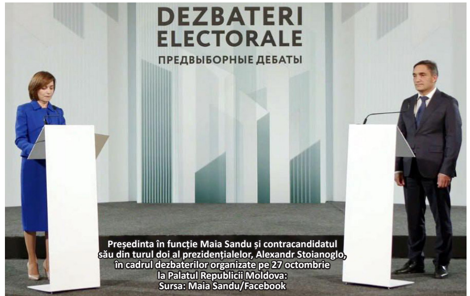
Președinta în funcție Maia Sandu și contracandidatul său din turul doi al prezidențialelor, Alexandr Stoianoglo, în cadrul dezbaterilor organizate pe 27 octombrie la Palatul Republicii Moldova

Republica Moldova aluneca pe gheață subțire în privința viitorului ei. Există în acest moment multă incertitudine privind viitoarea conducere de la vârful țării și modalitatea în care Republica Moldova își va continua drumul european. Dacă acesta va funcționa cu motoarele turate la maxim cu o conducere pro-europeană,