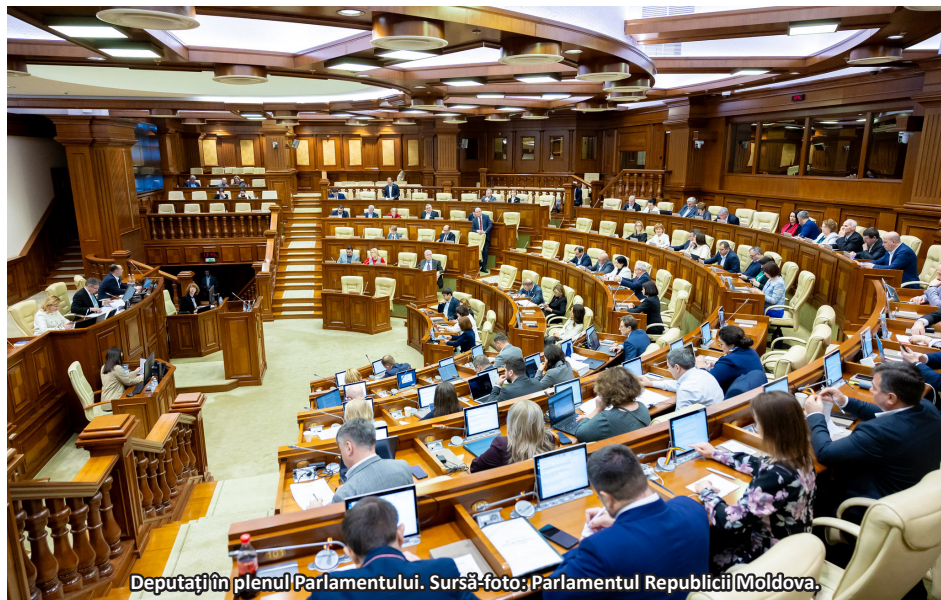
Deputați în plenul Parlamentului.

Republica Moldova se va confrunta cu foarte multe provocări în 2025. Totul este pus sub semnul imprevizibilității, deoarece criza energetică creată artificial de Rusia prin intermediul regiunii separatiste transnistrene nu dă semne de rezolvare prea curând.